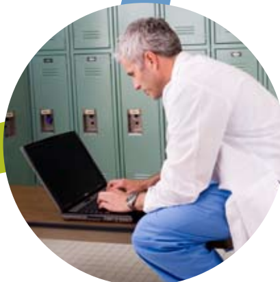
Daten in jeder Phase der Therapie bündeln und integrieren