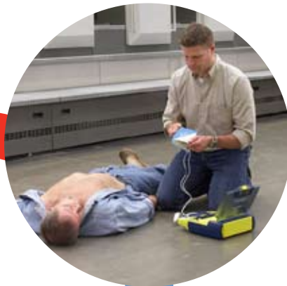
Plötzlichen Her zstillstand behandeln und Leben retten